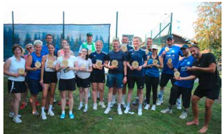
Sieger der Kiebitz Open